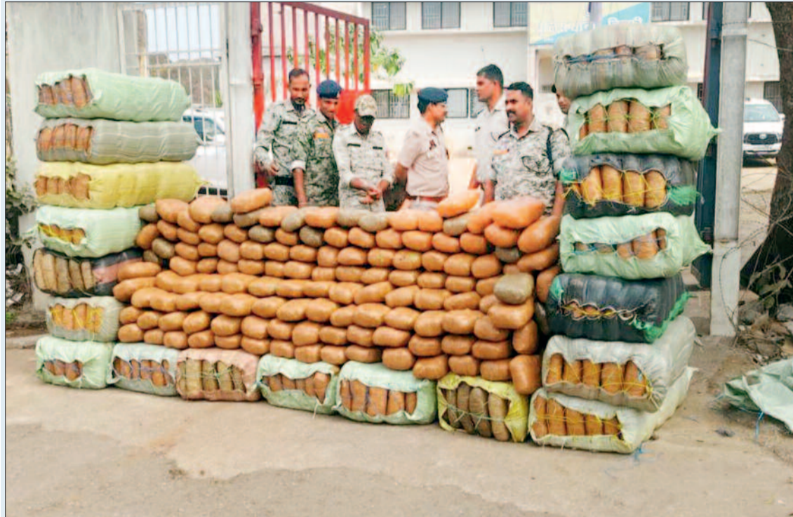
गुप्त चैम्बर बनाकर उसमें बड़ी मात्रा में गांजा छिपाकर रखे गए गांजा को देखा। पुलिस ने कंटेनर के गुप्त चैम्बर से 30-30 किलो की 30 बैरियों में भरा हुआ गांजा बरामद किया गया। कुल जब्त मादक पदार्थ का वजन करीब 9 क्विंटल (900 किलोग्राम) बताया जा रहा है। जिसका बाजार मूल्य करीब 5 करोड़ रूपए आंका गया है।

मादक पदार्थ तस्करी के खिलाफ चलाए जा रहे अभियान के तहत कबीरधाम पुलिस ने मंगलवार को बड़ी सफलता हासिल करते हुए जिले के सीमावर्ती थाना मुख्यालय चिल्फीघाटी से करीब 9 क्विंटल गांजा बरामद किया है जिसका बाजार मूल्य करीब 5 करोड़ रूपए आंका गया है। पुलिस ने इस मामले में जहां एक आरोपी को गिरफ्तार किया है वहीं गांजा तस्करी में प्रयुक्त करीब 50 लाख कीमत का नागालैंड पासिंग एक कंटेनर भी जप्त किया है। इस संबंध में पुलिस प्रशासन से मिली जानकारी के अनुसार उसे मंगलवार की सुबह मुखबिर के जरिए इस बात की सूचना मिली थी कि उड़ीसा से गांजा की बड़ी खेप एक नागालैंड पासिंग कंटेनर में भरकर कवर्धा कवर्धा होते हुए चिल्फी के रास्ते ले जाई जा रही है। इस सूचना पर तत्काल कार्यवाही करते हुए जिले की सीमावर्ती चिल्फीघाटी पुलिस ने नेशनल हाईवे 30 में बैरिकेडिंग पर संबंधित वाहन को रोक लिया और वाहन की तलाशी शुरू की। तलाशी के दौरान पुलिस के उस समूह को उड़ गए जब उसने कंटेनर में