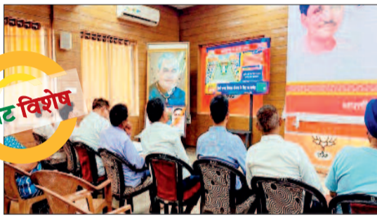
राजनांदगांव। जिला भाजपा कार्यालय में भाजपा कार्यकर्ताओं ने बजट का सीधा प्रसारण देखा।

प्रदेश की साय सरकार ने मंगलवार को अपना तीसरा बजट पेश कर दिया है। इस बजट में राजनांदगांव जिले के लिए भी कई घोषणाएं की गई हैं। जिनमें जिले में फिजियोथेरेपी कॉलेज, इंडस्ट्रियल काम्प्लेक्स के साथ ही सड़कों के विस्तार के लिए करोड़ रुपए का प्रावधान किया गया है। इसमें राजनांदगांव बायपास के 12 किमी में फोरलेन निर्माण के लिए 4.60 करोड़ रुपए खर्च किए जाएंगे। इसके अलावा राजनांदगांव के साथ ही एमएससी एवं केसीजी जिले के लिए भी कई घोषणाएं इस बजट में की गई हैं। तीनों ही जिलों में सड़क एवं पुल-पुलिया निर्माण पर अधिक फोकस किया गया है।