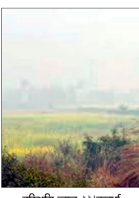
हरिभूमि न्यूज ►► कवर्धा

रबी फसलों, वनोपज और खुले में रखे समर्थन मूल्य के धान पर मंडराया खतरा बदले मौसम और बारिश ने बढ़ाई किसानों की चिंता